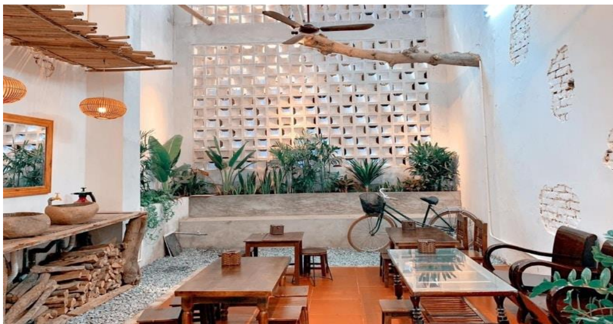
Hình 1: Hình minh họa phong cách quán