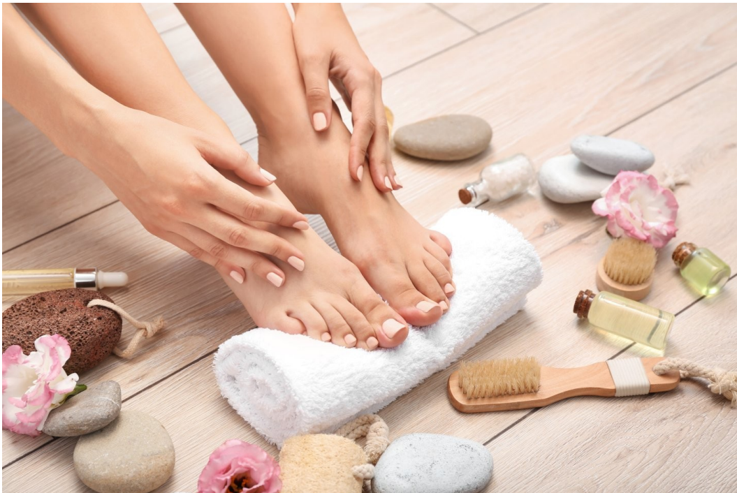
Hình 5: Nhờ tính sát khuẩn và hương thơm của thảo dược, muối ngâm chân thảo mộc có thể khử mùi hôi chân