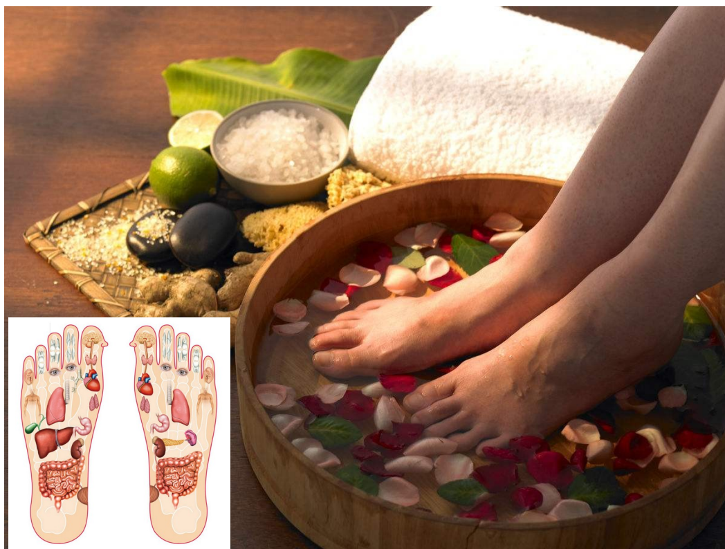
Hình 1: Muối ngâm chân thảo mộc tác động đến các tạng và các dây thần kinh trên toàn cơ thể

Bàn chân được ví như “Trái tim thứ hai” của cơ thể bởi nó có nhiều đầu mút thần kinh liên kết phản xạ trực tiếp tới võ đại não. Theo Y Học Cổ Truyền thì bàn chân chứa nhiều vị trí huyết đạo quan trọng có sự liên kết mật thiết với các tạng phủ trong cơ thể người, mỗi tạng phủ đều có điểm phản xạ tương ứng trên đôi bàn chân.