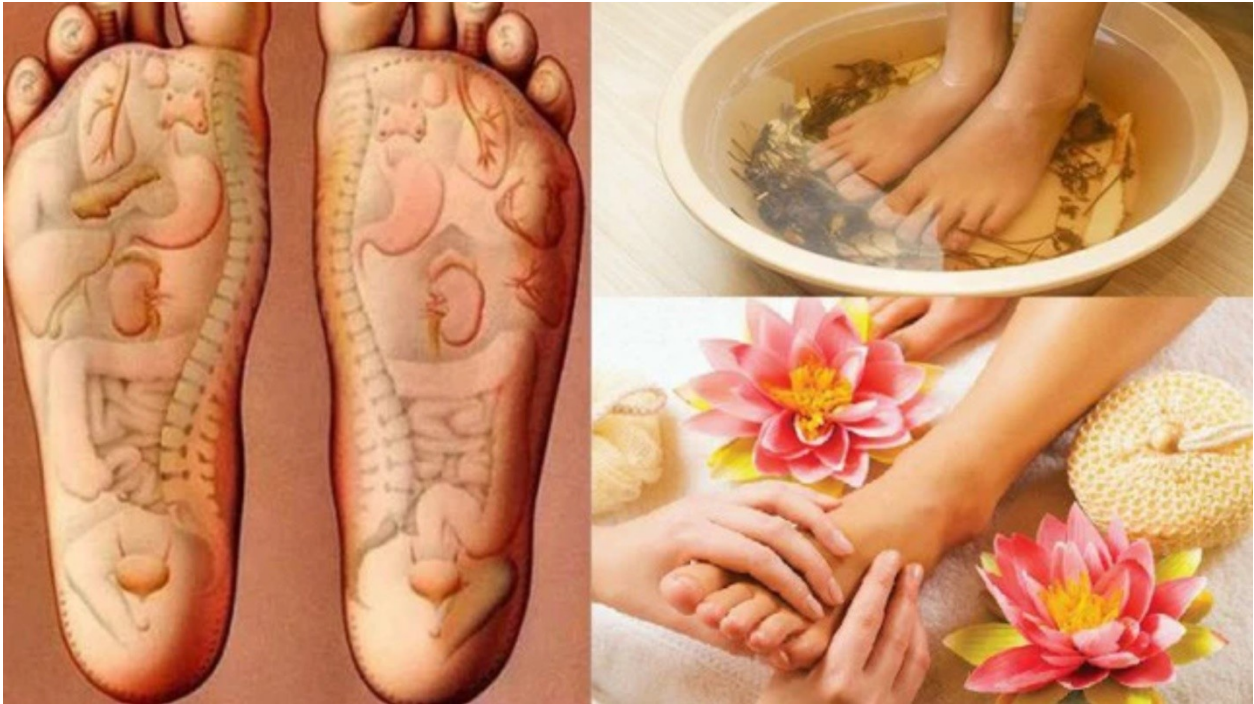
Hình 6: Muối thảo mộc ngâm chân giảm áp lực máu lưu thông lên tim và mạch máu, lưu thông khí huyết dễ dàng

cơ thể, giảm đi áp lực lượng máu cho tim và các mạch máu, cơ thể được thả lỏng một cách hiệu quả nhất.