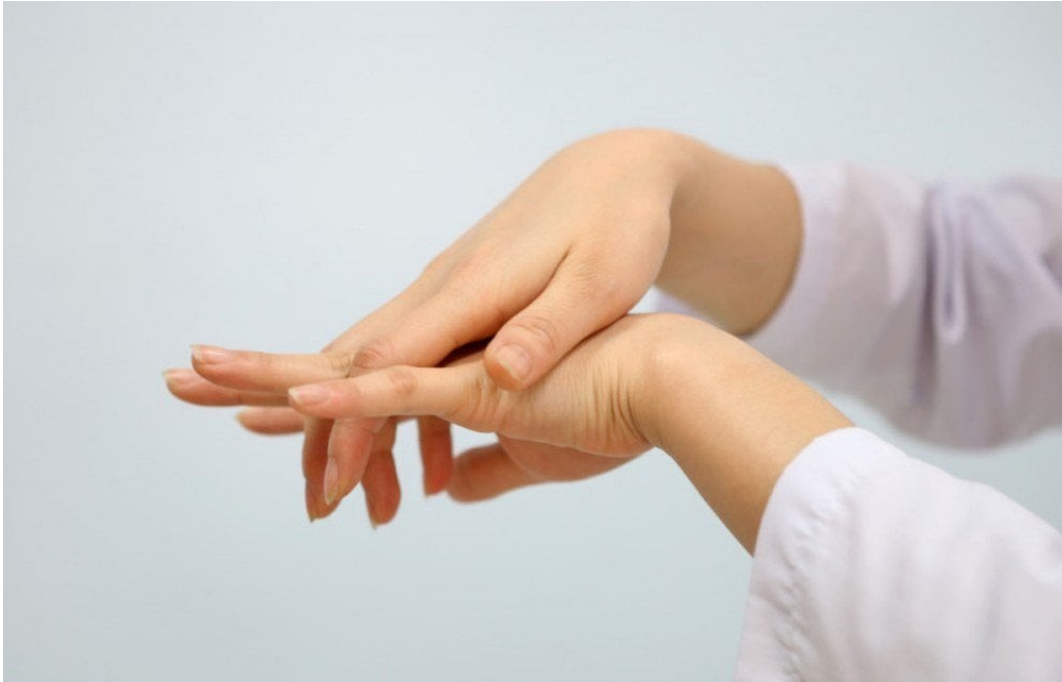
Hình 4: Muối thảo mộc ngâm chân cân bằng nhiệt độ cơ thể, giảm tình trạng ê buốt chân tay

nhiệt độ cơ thể, giảm bớt tình trạng ê buốt tay chân khi mùa đông đến hoặc khi sử dụng đồ lạnh