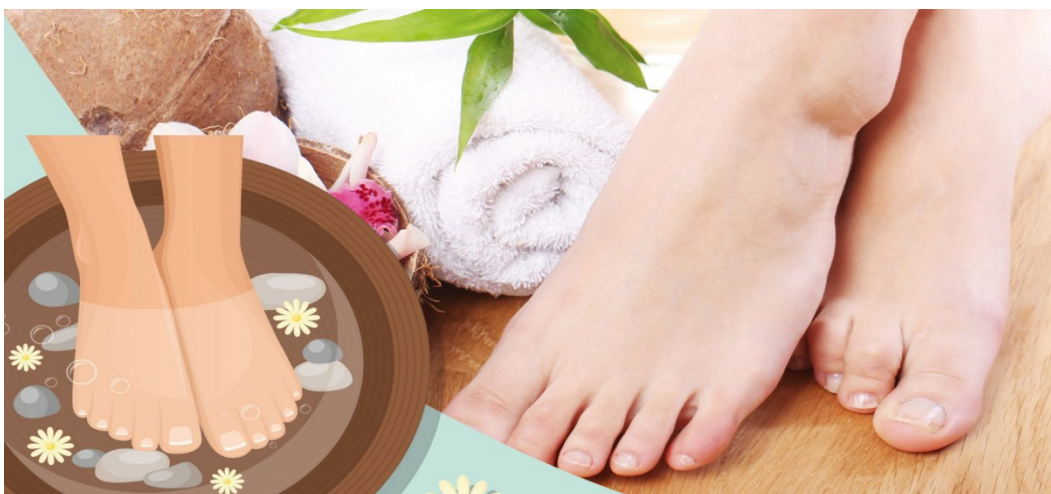
Hình 8: Cách sử dụng muối thảo mộc ngâm chân để tăng tác dụng hiệu quả

Bên cạnh việc hiểu được những công dụng đặc trưng của muối ngâm chân thảo mộc, bạn cần biết cách sử dụng loại muối này đúng cách và đều độ để gia tăng tác dụng của muối ngâm chân.