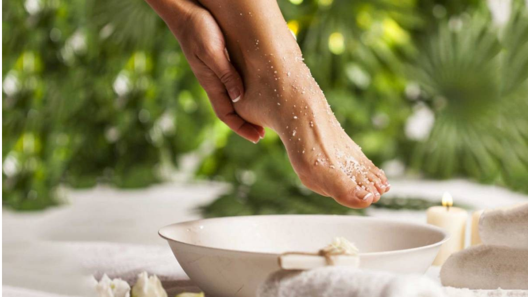
Hình 3: Muối thảo mộc ngâm chân gia tăng tuần hoàn máu nuôi khớp, giảm đau nhức xương khớp khi vận động

- Giảm đau nhức xương khớp: Khi bạn bị viêm khớp, thoái hoá khớp, đau nhức xương khớp do vận động, hoặc va chạm, khi dùng muối ngâm chân thảo mộc sẽ giúp gia tăng lưu thông trong tuần hoàn máu, tăng lượng máu nuôi các xương khớp và lương bạch cầu để ngăn ngừa chứng viêm khớp.